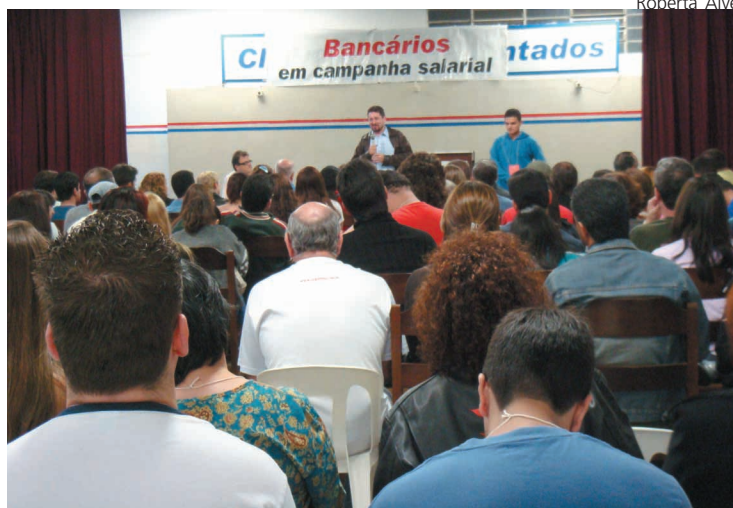
Vanderlei Siraque participa de assembléia (08/10) da campanha salarial deste ano e se solidariza com a luta dos funcionários da Caixa Federal, em greve naquele momento

O vínculo de Siraque com a categoria bancária no ABC é antigo. Ele prestou assessoria ao Sindicato num período decisivo para a representatividade da entidade. Vereador por Santo André em três gestões e deputado estadual por duas, sempre pelo PT, Siraque destaca ainda em sua atuação as preocupações com as áreas de segurança pública, participação popular e con-